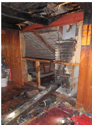
Trám prechádzajúci cez komínové teleso