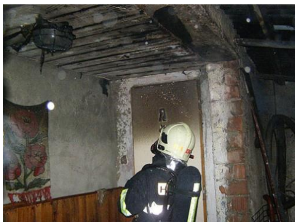
Požiar v priestore povaly spôsobený komínovým telesom